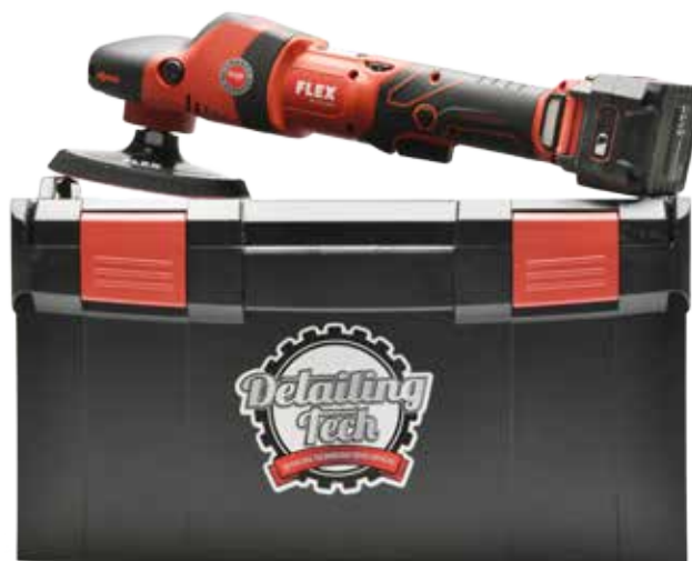
LUCIDATRICE A BATTERIA 18,0 V

La lucidatrice rotativa è quella che noi consigliamo per la fase di "taglio" o "sgrosso", poiché grazie al movimento rotativo, riesce ad essere più veloce ed incisiva nella rimozione di carteggiature, righe e danni ingenti sulla carrozzeria.